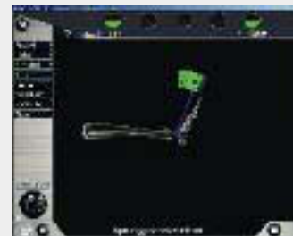
Bestimmung des Sprunggelenkmittelpunktes