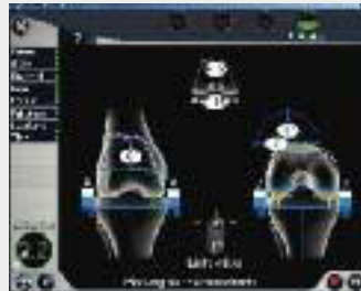
Überprüfung der Position der Implantatkomponenten