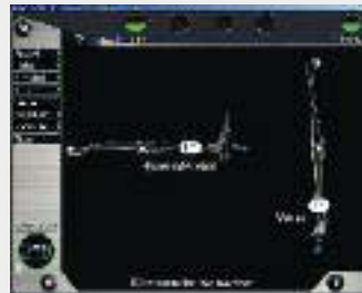
Dokumentation der post-operativen Beinachse