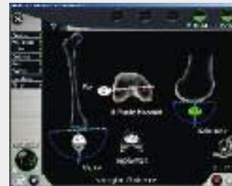
Ausrichtung der Schablone zur Präparation des Oberschenkelknochens