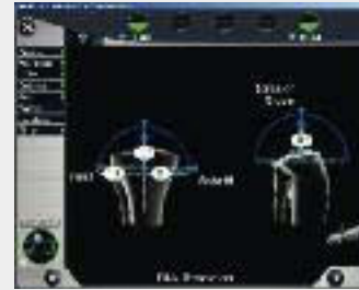
Präparation des Unterschenkelknochens

Anschließend wird unter Berücksichtigung der Weichteile (Gelenkkapsel und Bänder) der Gelenkspalt gemessen. Sollte es z. B. zu einer Verkürzung der Bänder im Gelenk gekommen sein, kann dies korrigiert werden, um eine hohe Stabilität und Funktion des Kniegelenks zu erzielen. Durch die am OrthoPilot® ange-