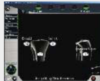
Überprüfung der Sägeschnitte