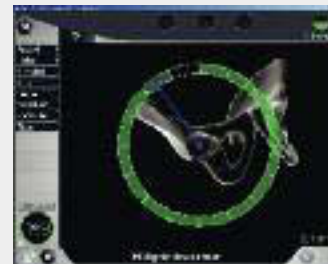
Erfassung des Hüftgelenkszentrums