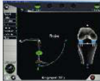
Messung und Anpassung der Gelenkspalten

Danach werden Drainagen (Schläuche) gelegt, um das Abfließen des Blutergusses zu ermöglichen. Die Knieöffnung wird dann schichtweise wieder zugenäht.