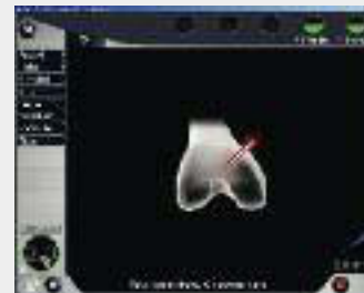
Registrierung des Kniezentrums

Nach einem Hautschnitt werden die Muskulatur und die Kniescheibe zur Seite geschoben und das Kniegelenk frei gelegt.